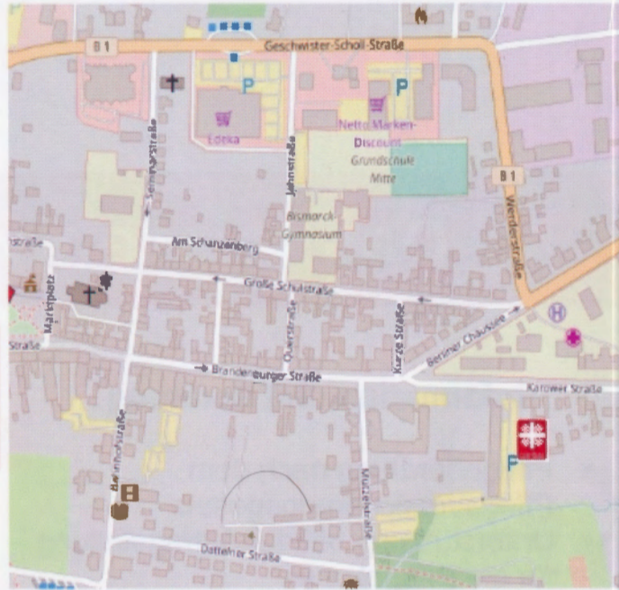
Karte hergestellt aus OpenStreetMap-Daten | Lizenz: Open Database License (ODbL)